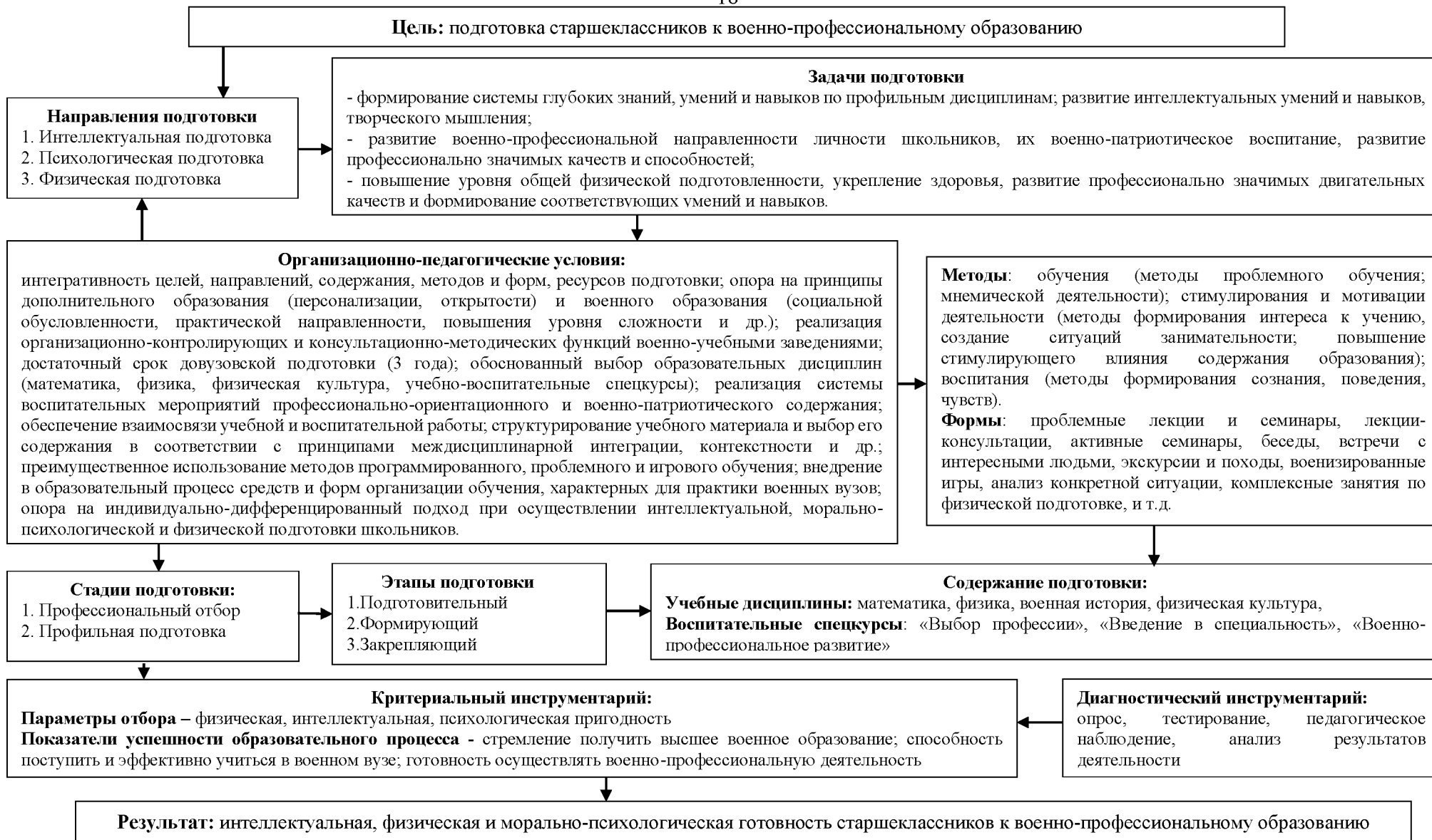
Рисунок 2 – Модель интегративной довузовской подготовки старшекласников к военно-профессиональному образованию