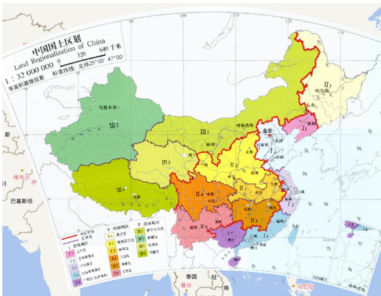
Карта 6. Районирование земельных ресурсов Китая