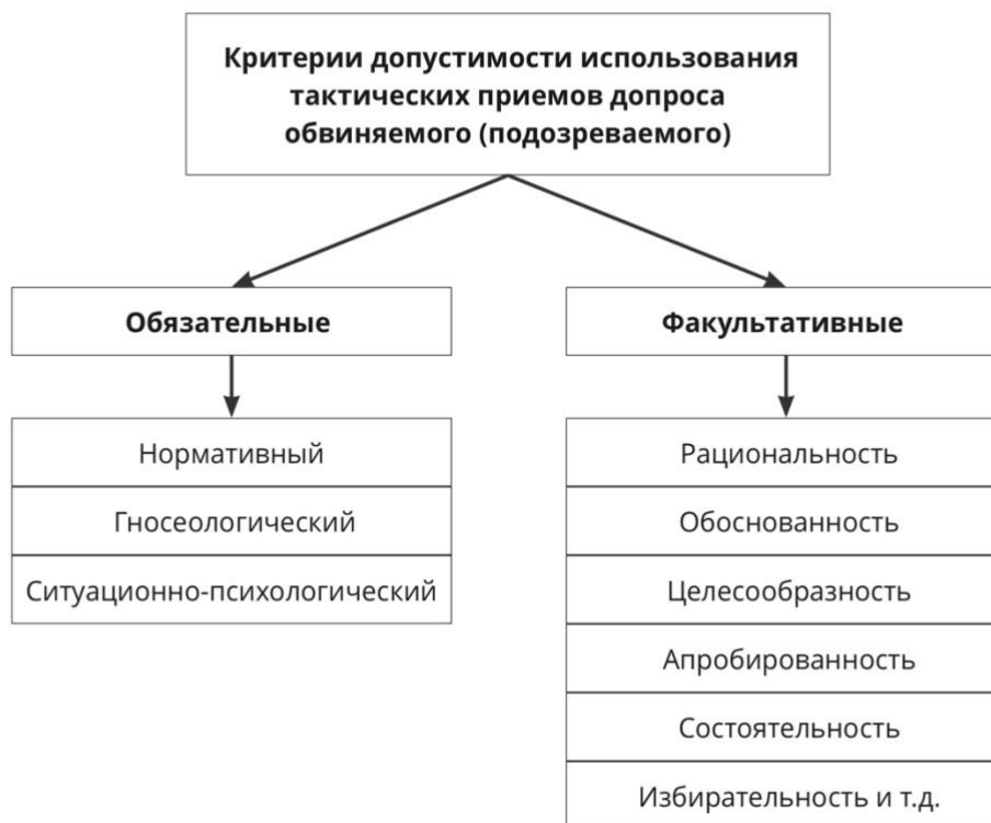
Рис. 1 – система критериев допустимости использования тактических приемов допроса обвиняемого (подозреваемого)