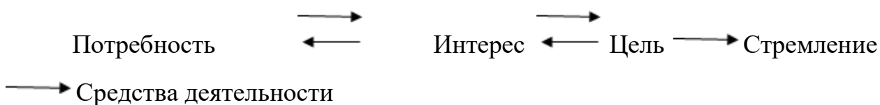
Схема 2. Формирование мотива поведения

Мотив содействия. Основополагающим при содействии подозреваемого (обвиняемого) расследованию преступления является мотив поведения — внутреннее побуждение к деятельности 2 (схема 2).