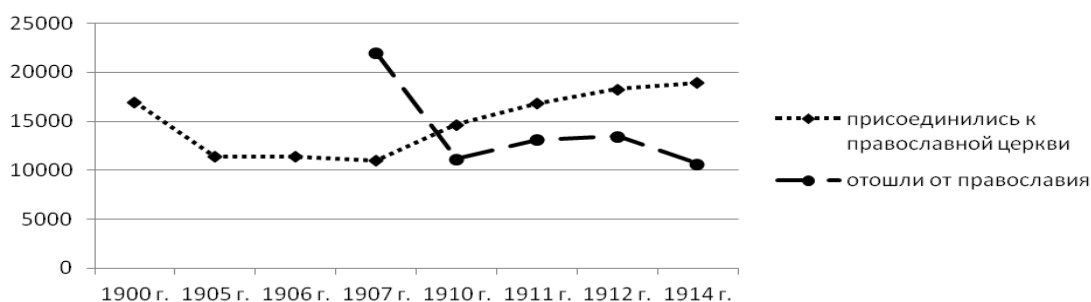
Рис. 1. Динамика религиозной мобильности в Российской империи[11] (по вертикали указано количество чел.)

В 1907 г. в Российской империи из других конфессий в православие пе-