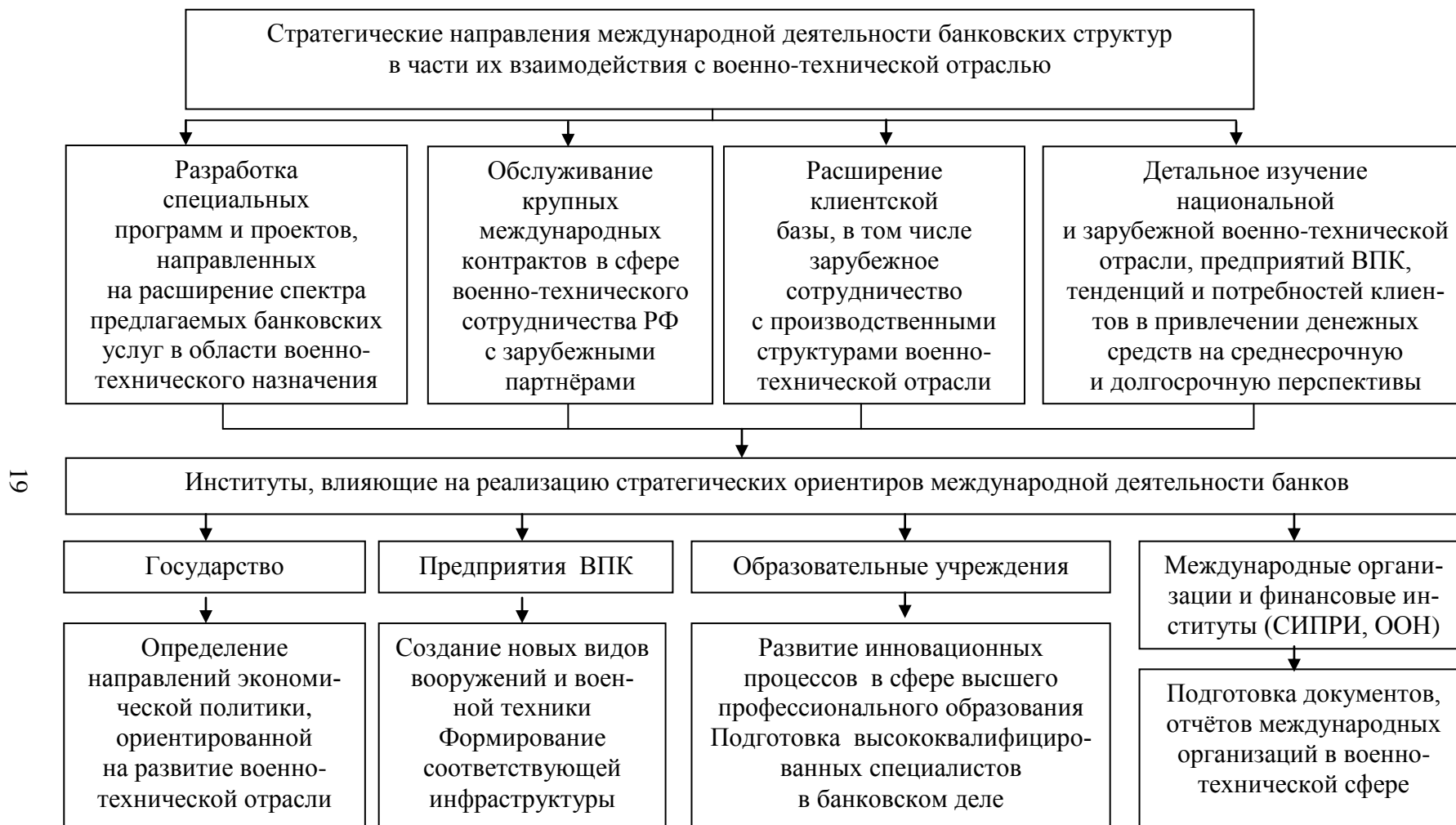
Рис. 5. Стратегические направления международной деятельности банковских структур в части их взаимодействия с военно-технической отраслью 1