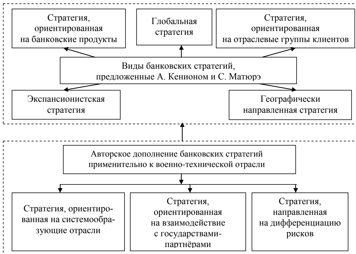
Рис. 2. Классификация банковских стратегий применительно к военно-технической отрасли 1

Структурные трансформации, происходящие в настоящее время в глобальной финансовой сфере, выявили необходимость качественных изменений в стратегиях развития банков. Именно поэтому поиск стратегических направлений организации финансово-хозяйственной деятельности банков становится обязательным условием для успешного решения поставленных перед ними задач. Автором обоснована необходимость привлечения крупнейших банковских структур в военно-техническую отрасль. На этой основе предложены виды банковских стратегий, расширяющие представления А. Кениона и С. Матюрэ в части привлечения банковского капитала в военно-техническую отрасль (рис. 2).