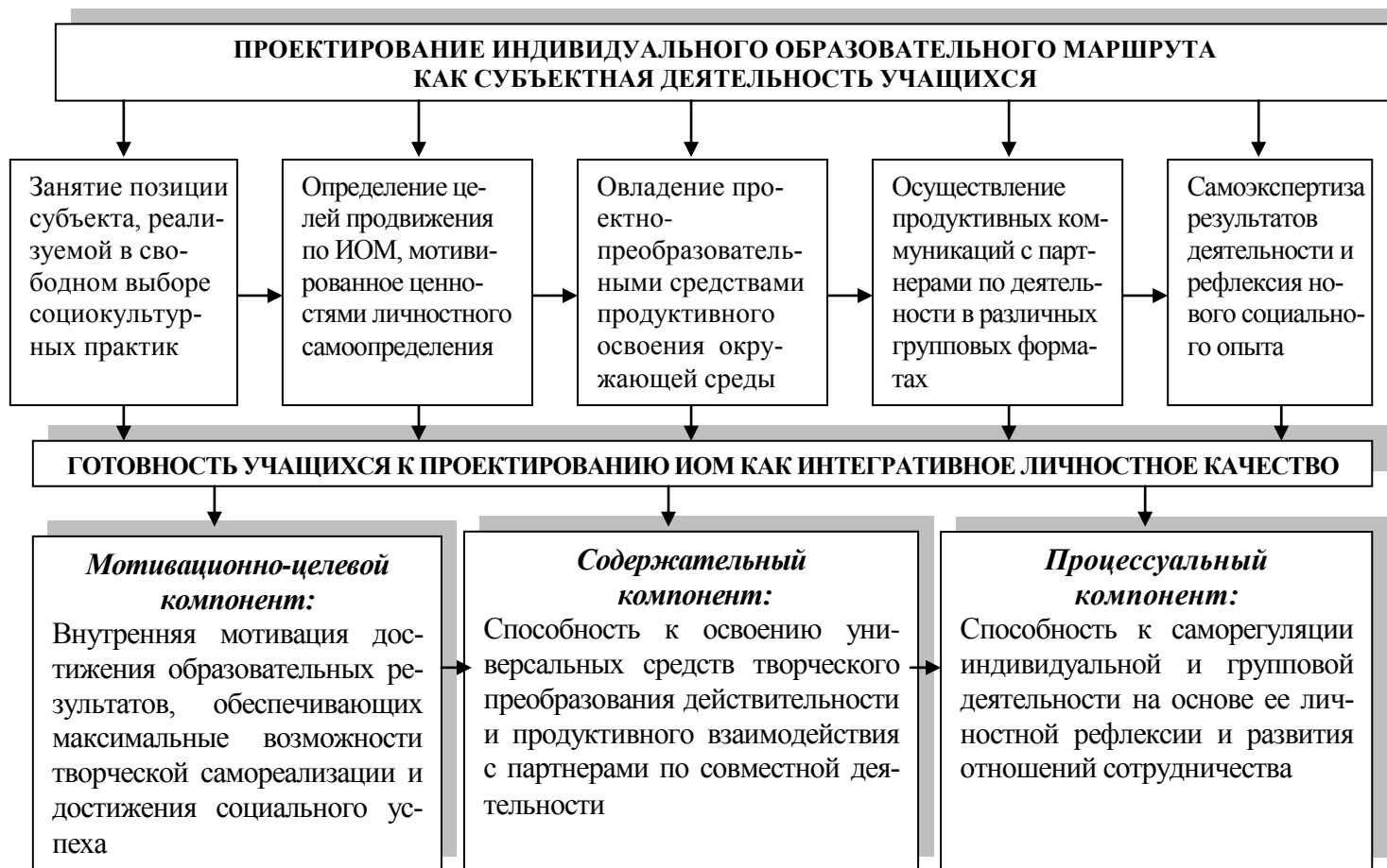
Рис. 1. Содержание и структура готовности ученика к проектированию индивидуального образовательного маршрута

Раскрыто понятие проектирования ИОМ как нового вида образовательной деятельности учащихся, осуществляемой ими в процессе освоения свободно выбираемых социокультурных практик, результатом чего становится определение их индивидуального отношения к различным сферам общественной жизни. Построена модель готовности как интегративного личностного качества, обеспечивающего занятие учеником субъектной позиции в выборе целей, содержания и средств собственной образовательной деятельности, ее планирования и оценки достигаемых результатов на основе единства смыслообразующих мотивов, способов действий и регулятивных способностей. Результаты этой работы представлены на рис. 1.