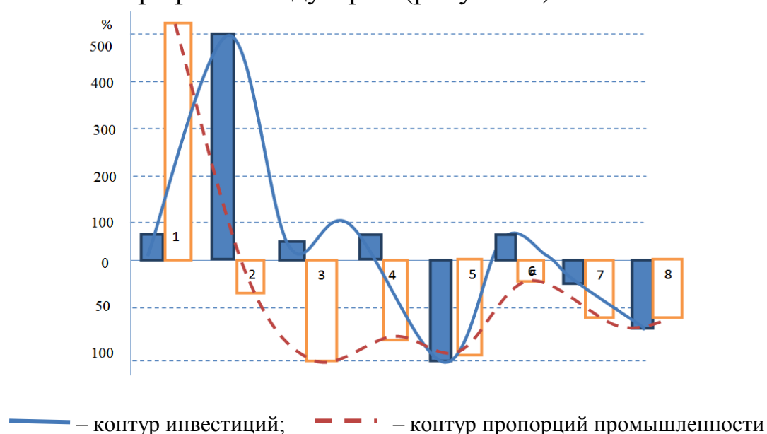
Рисунок 2 – Профиль российской промышленности 1 :

ганизационной структурой. Технологическая структура современного российского производства может быть охарактеризована национальным профилем индустрии (рисунок 2).