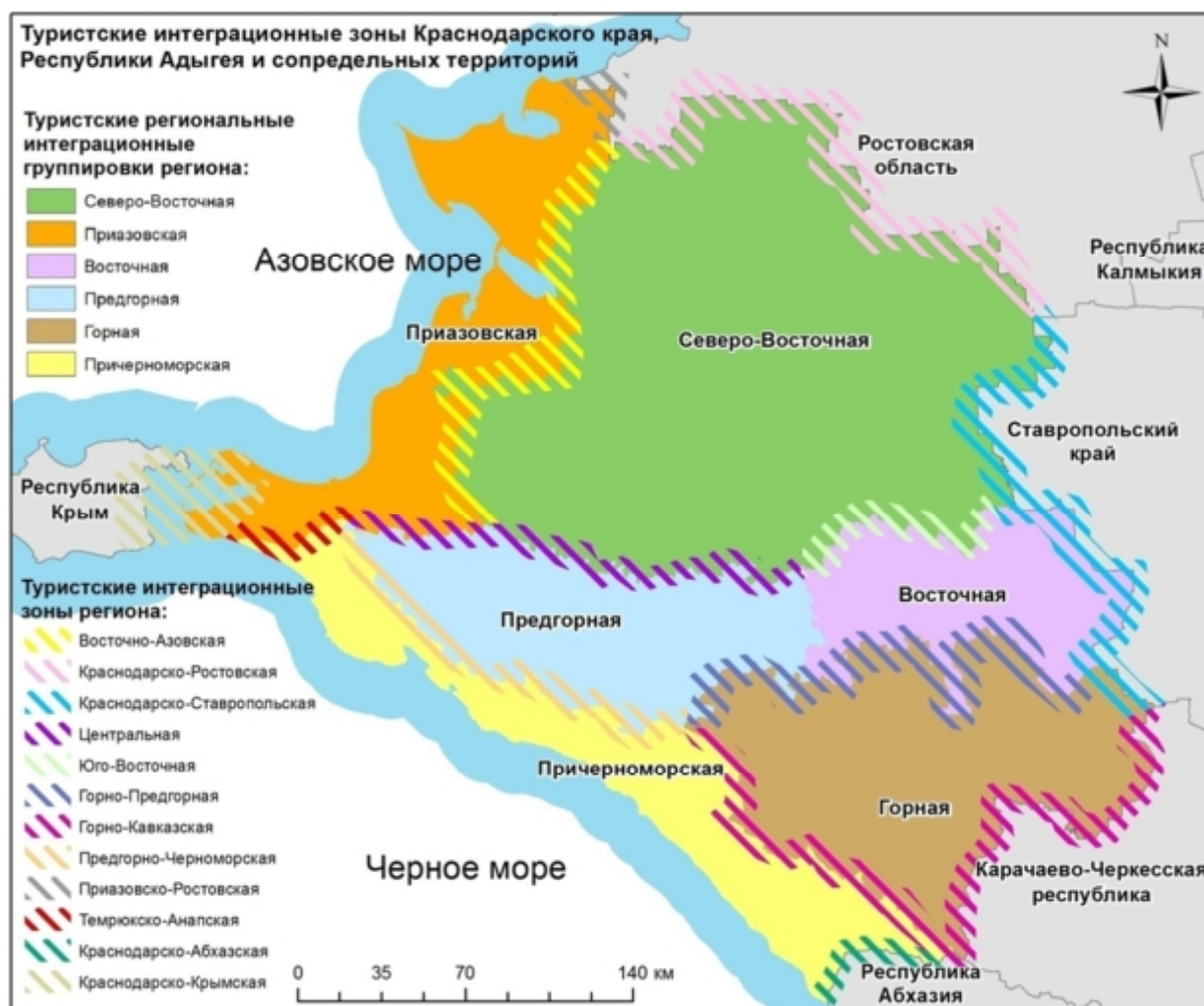
Рисунок 3 – Туристские интеграционные зоны Краснодарского края, Республики Адыгея и сопредельных территорий (составлено автором)

На основе исследования, выделенные ТИЗ, были объединены в группы, согласно развитости туристской сферы. К первой группе трансграничных интеграционных зон с туристским продуктом, приносящим стабильный доход относятся – Предгорно-Черноморская, Темрюкско-Анапская, Краснодарско-Абхазская и Краснодарско-Крымская ТИЗ. Вторая группа ТИЗ Восточно-Азовская, Приазовско-Ростовская, Центральная, Горно-Предгорная и Горно-Кавказская относится к территориям перспективным с положительной динамикой развития туристкой отрасли. Третья группа ТИЗ Краснодарско-Ростовская, Краснодарско-Ставропольская и Юго-Восточная, востребована только местным населением и не имеет регионального или федерального значения.