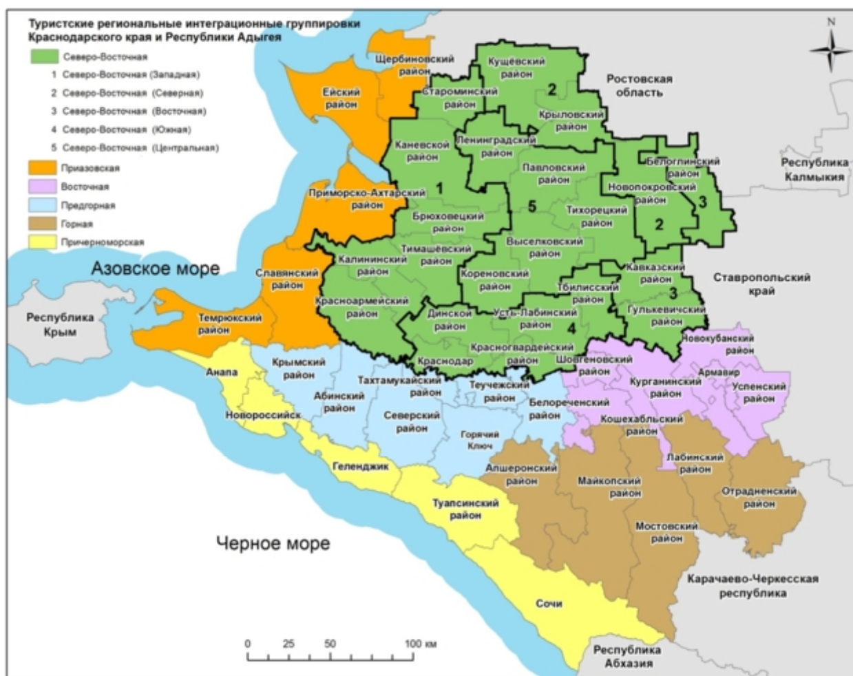
Рисунок 2 – Туристские региональные интеграционные группировки Краснодарского края и Республики Адыгея (составлено автором)

На основе проведенного исследования и формирования ТРИГ, было сформулировано определение туристской региональной интеграционной группировки.