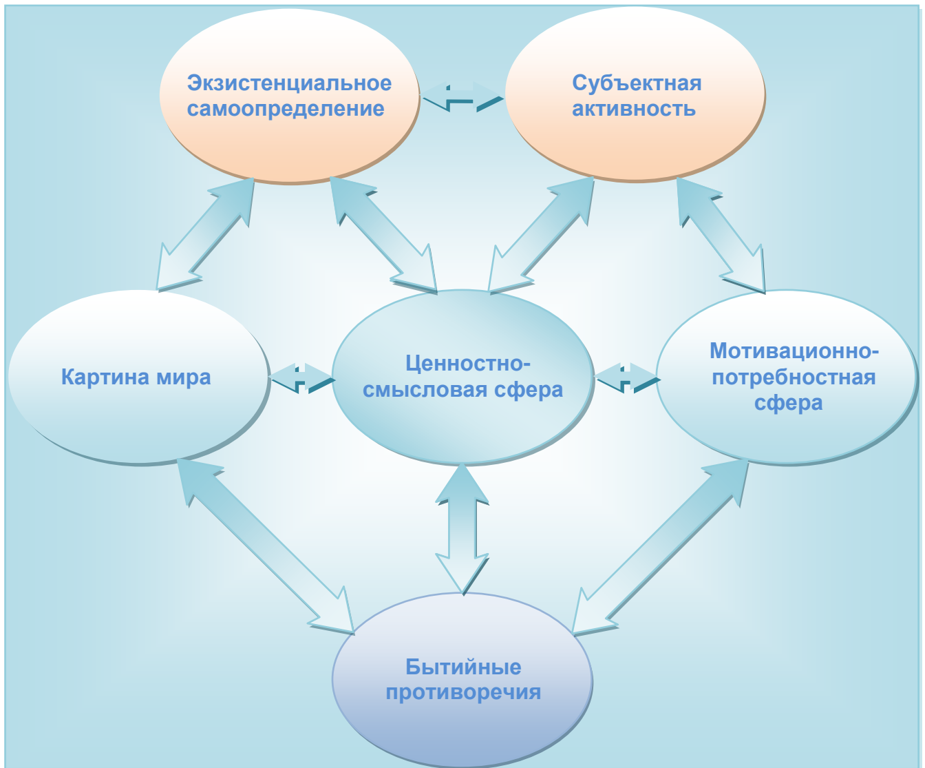
Рисунок 1. Компоненты структурно-диалектической модели протестной активности личности.

Формы протестной активности личности мы рассматриваем в широком онтологическом плане как способы существования личности, оформившиеся в результате процесса экзистенциального самоопределения и субъектной активности личности . Компоненты структурно-диалектической модели протестной активности личности представлены на рисунке 1.