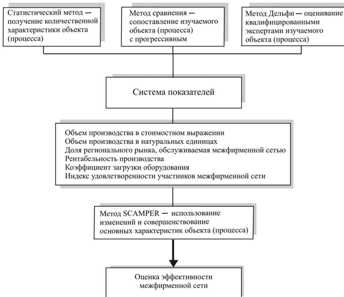
Рис. 2. Структурно-логическая схема оценки эффективности межфирменной сети 4

Структурно-логическая схема оценки эффективности межфирменной сети представлена на рис. 2.