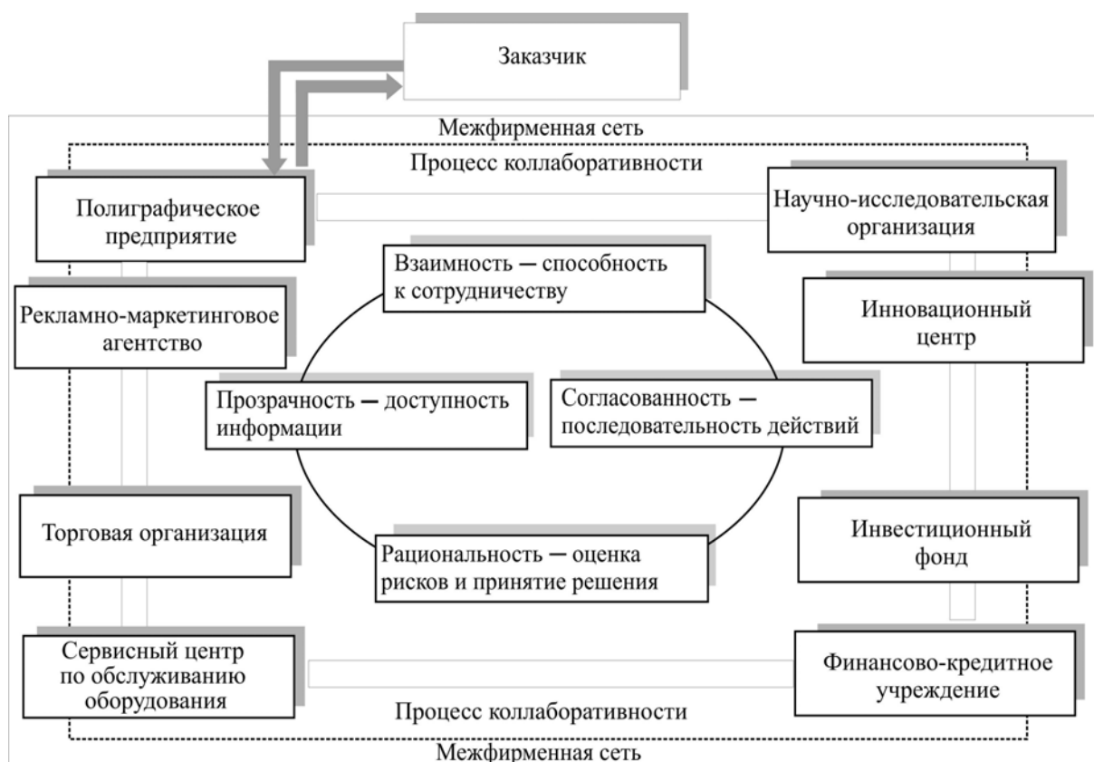
Рис. 1. Процесс коллаборативности межфирменного сетевого взаимодействия в региональном полиграфическом комплексе 2

Соискатель рассматривает межфирменные сети как форму взаимодействия хозяйствующих субъектов, позволяющую более эффективно использовать совокупные ресурсы участников межфирменной сети и тем самым повысить их конкурентоспособность в условиях нестабильности внешней среды. Вектор исследования смещен в сторону коллаборативных процессов, концентрирующих совместные усилия фирм-участниц для достижения целей при реализации бизнес-проектов (рис. 1).